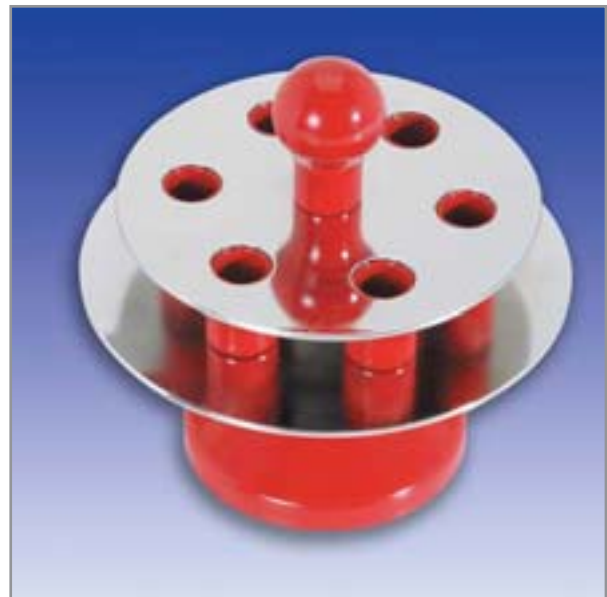
2440 Magnetischer Bohrerständer Magnetic Bur Holder