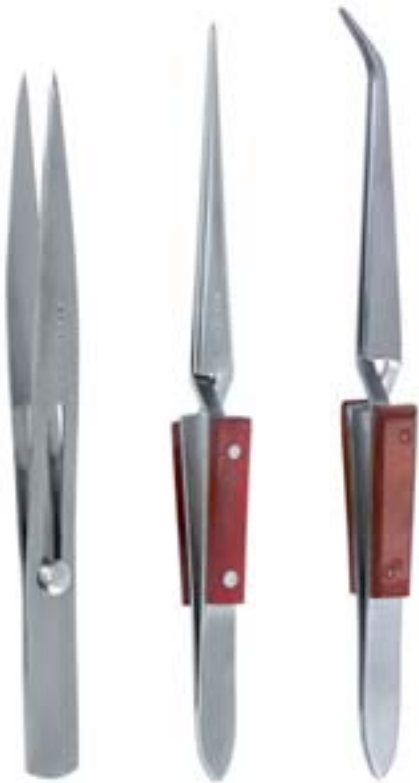
1780 / 12 cm 1780 / 16 cm