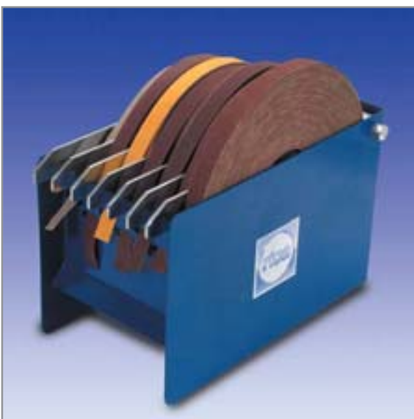
1560 Schleifbandhalter Abrasive Band Holder