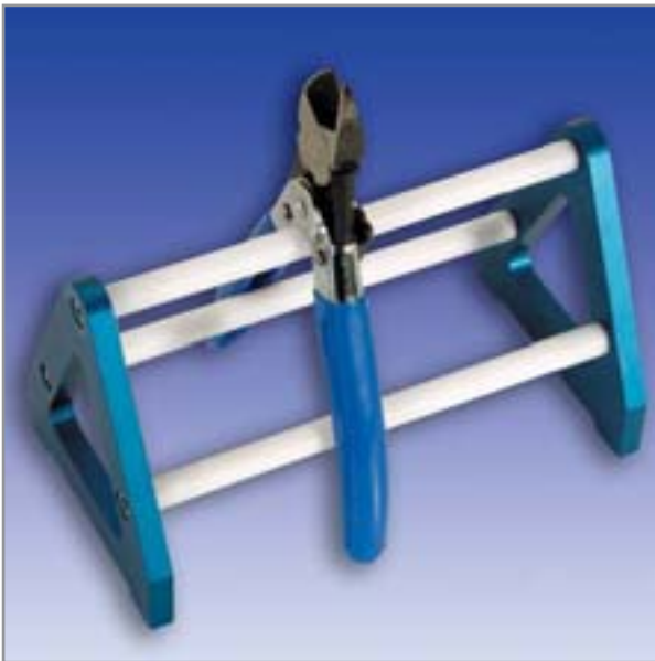
2133 Zangenständer Forceps Holder

Nützliche Helfer im Labor Useful things for laboratories